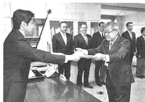
は北海道電気工事(札幌)

二十八年度開発局優良工事等表彰の営繕部長表彰式が二十六日、札幌第一合同庁舎で執り行われた。工事