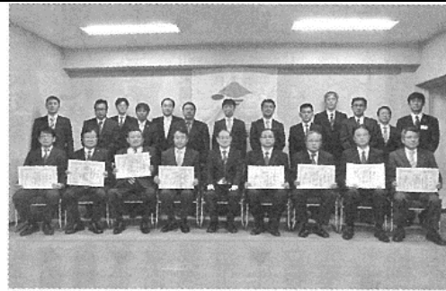
工事で村上市建設工業(株)、徳井建設工業(株)、宮坂建設工業(株)、北央道路・北洋・夢中J-V、萩原建設工業(株)、高堂建設(株)の五社一J-Vが受賞。

【帯広発】帯広開建は二十八日、本部庁舎で二十八年度優良工事等表彰の部長表彰式を執り行った。写真。工事部門は六件、業務部門は七件、五社一J-Vで八社が受賞。業務部門は七件、五社一J-Vで、重複除き七社が栄誉に