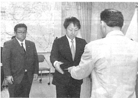
また、「支えてくれる家族がいたからこそ、技術力

【室蘭発】室蘭開建は二十八年度開発局度優良工事等表彰の部長表彰式を執り行った。工事部門では北興工業(室蘭)など十社、業務部門では八社が受賞。宮島滋