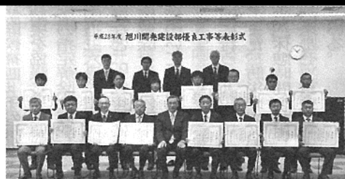
旭川開建は二十八年度優良工事等表彰式